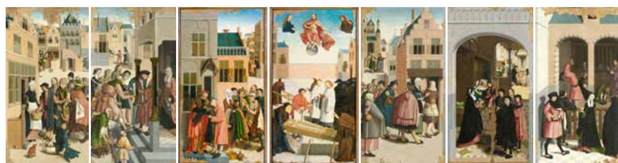
Meester van Alkmaar, 'De zeven werken van barmhartigheid', 1504, 120 cm x 472 cm